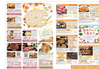
グルメ特集広告見本