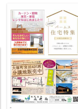
住宅特集広告見本